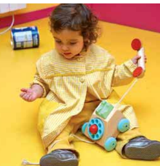
Fig. 2.5. Entre los 12 y los 17 meses, el niño realiza gestos asociados con objetos fuera del contexto real en que son usados.

En esta franja de edad tan amplia, entre los 2 y los 6-7 años aproximadamente también se producen cambios sustanciales en este tipo de juego. De hecho, se considera que ya existe juego presimbólico antes de los 2 años como se verá a continuación (Tabla 2.1).