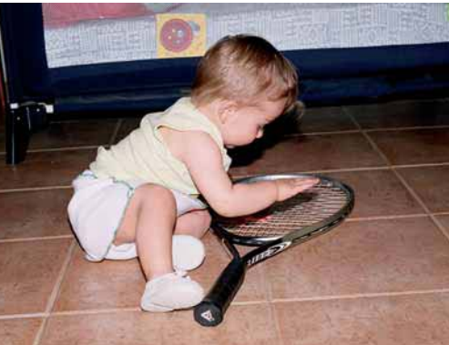
Fig. 2.3. Bebé de diez meses gateando para alcanzar un objeto.

Los mimos son un tipo de juego que el adulto realiza con el bebé acariciando alguna parte de su cuerpo (sobre todo las manos y la cara) mientras canta una canción o recita un texto.