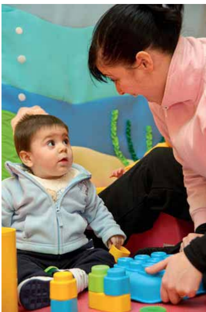
Fig. 2.13. El juego es la forma de comunicación más frecuente que utiliza el adulto para relacionarse con los niños.

Tanto los padres como el niño hacen descubrimientos en el juego. Por una parte, los padres ven lo que le gusta a su hijo, lo que puede hacer, cómo reacciona ante el éxito, el fracaso o en situaciones divertidas. Por otra parte, siendo su dominio el del juego, el niño sabrá, sin ninguna duda, sorprender al adulto con su ingenio y su imaginación y ser el objeto de la atención del adulto, lo cual le procurará confianza y seguridad.