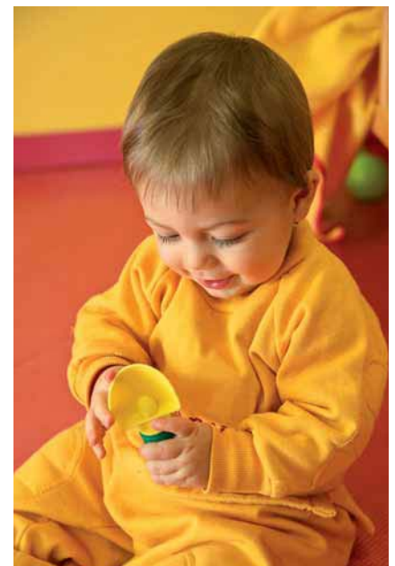
Fig. 2.2. Bebé examinando los objetos con las manos y la mirada.