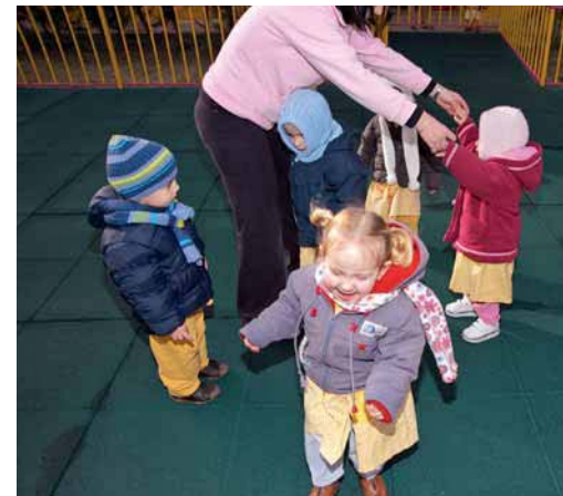
Fig. 2.9. El juego del «pasemisí, pasemisá» favorece el desarrollo de diversas competencias como la atención y la reflexión.

Un mismo juego se puede realizar variando las reglas del mismo siempre que sean asumidas por todos los jugadores.