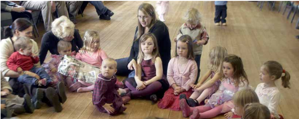
Fig. 2.14. La educación y la formación de los padres debe formar parte de la propia educación de los niños, ya que es un recurso necesario para ayudarles a crecer y a desarrollarse de forma adecuada.

Organizar juegos y actividades familiares agradables para todos crea momentos mágicos en la familia, que dejarán un recuerdo imperecedero.