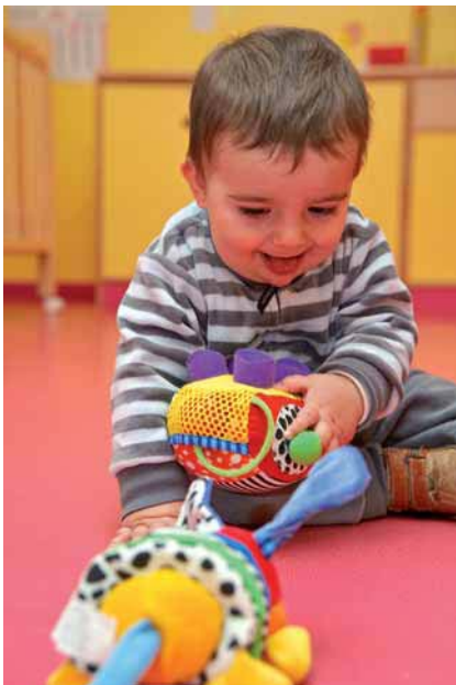
Fig. 2.11. La motricidad fina y la coordinación óculo-manual se van desarrollando paulatinamente en el niño a partir de los 4 meses; le permiten fijarse en un objeto y sujetarlo con la mano, hacerlo rodar.

La coordinación óculo-manual consiste en la cooperación de los ojos y las manos para dirigir los movimientos y coger un objeto.