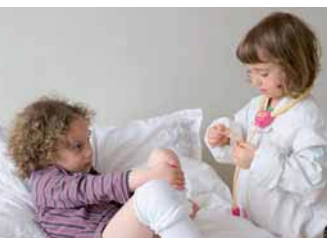
Fig. 2.7. A partir de los 4 años, los niños realizan un juego de ficción más complejo, con más personajes y más secuencias de acciones (médico, enfermera, paciente, situación tras el parto, etc.).