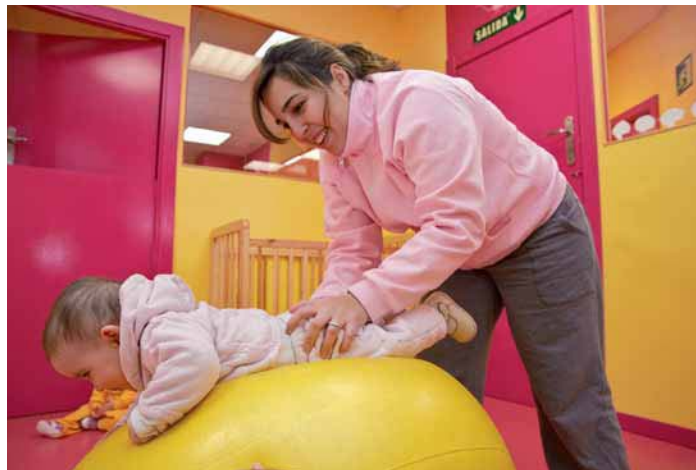
Fig. 2.15. La educación temprana trata de abrir canales sensoriales (tacto, movimiento, olor...) para que el niño adquiera mayor información del mundo que le rodea.

Se trata, pues, de abrir canales sensoriales (tacto, movimiento, olor...) para que el niño adquiera mayor información del mundo que le rodea. Ya desde bien pequeño, el bebé descubre las cosas examinando cómo su mundo afecta a su cuerpo. Aquí podemos ver la importancia de las sensaciones en su aprendizaje, cuando el pequeño es capaz de tomar las cosas en sus manos, comienza a explorar y a entender la relación entre causa y efecto. Lo podemos ver también cuando suelta un objeto y lo vuelve a hacer repetidamente, está observando y descubriendo qué es lo que sucede, posteriormente lo lanzará desde su silla. Un bebé adquiere nuevas habilidades constantemente.