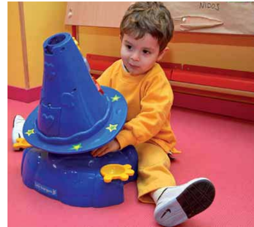
Fig. 2.4. Bebé de dos años activando un juguete por sí mismo.

En cuanto a la imitación, tan estimulada por los juegos de interacción social durante los períodos anteriores, en este momento empieza a ser diferida . A partir de ahora, el niño es capaz de imitar todo tipo de acciones en ausencia total del modelo. Así, es frecuente ver a los niños empezar a hacer como si comieran de un plato vacío o si hablaran por teléfono o a hacer como si fueran a costarse para dormir. Todas estas acciones son ya representaciones, un hacer algo como se da en la vida cotidiana, pero jugando. Este tipo de imitación abre las puertas a los niños al desarrollo del juego simbólico.