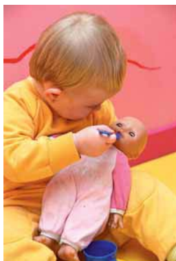
Fig. 2.6. Entre los 20 y los 22 meses, el niño realiza acciones simbólicas sobre los muñecos.