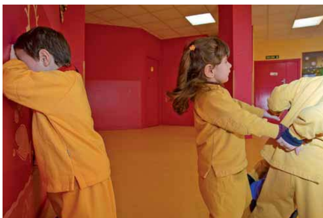
Fig. 2.8. Niños jugando al escondite inglés.

Será necesario que se produzca entre los niños una negociación más explícita del significado de las situaciones, del valor de los objetos y del rol de cada uno de los papeles asignados en ese tipo de argumento. Además será necesario que el niño que propone el juego se encargue de dirigir las acciones hasta que el otro o los otros tengan claro qué es lo que hay que hacer en el juego.