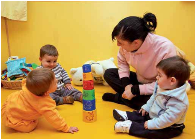
Fig. 2.12. Desde los 4 meses se establece una interacción mutua satisfactoria adulto-niño.

Veamos con detalle cómo se produce esa estimulación en el juego por parte de las figuras adultas claves para el niño: el educador y los padres .